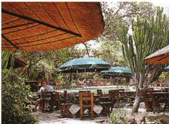
MABILA GAME LODGE

サファリに行くのなら、数日滞在するのがおすすめ。特に私営動物保護区での宿泊はプール、レストランなどの施設が整い、野趣あふれるロジもエアコン完備が一般的。サバンナに立つコテージ、カクテルを片手に夜空を見上げれば満天の星……。ロマンチックなサファリでの滞在はハネムーンにも人気です。